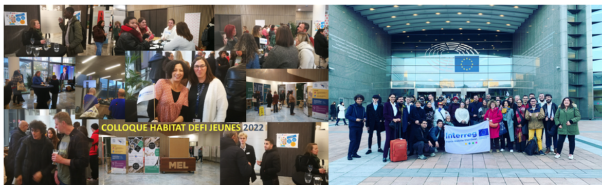
Colloque avec les élus & Parl'Europe Jeunes pour interpeler les élus européens

Ce Site Internet est le résultat d'un travail de coopération transfrontalière durant 6 années (2018 à 2023) autour de cette thématique. Le partenariat comprenait des écoles sociales et leurs étudiants d'un côté, des structures d'accompagnement social des jeunes en difficultés et les jeunes eux-mêmes de l'autre.